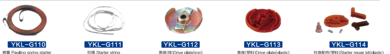
YKL-G110 卷簧 Pawling spring starter YKL-G111 拉绳 Starter string YKL-G112 盖盘(铁) Drive plate(iron) YKL-G113 盖盘(塑料) Drive plate(plastic) YKL-G114 拉盘配件(塑料) Starter repair kit(plastic)