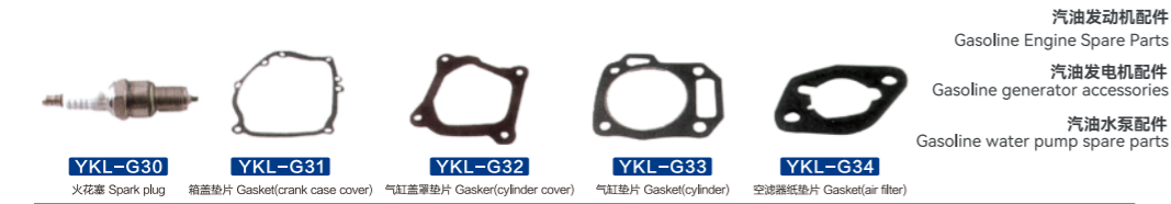
YKL-G30 火花塞 Spark plug YKL-G31 箱盖垫片 Gasket(crank case cover) YKL-G32 气缸盖罩垫片 Gasket(cylinder cover) YKL-G33 气缸垫片 Gasket(cylinder) YKL-G34 空滤器纸垫片 Gasket(air filter)

汽油发动机配件 Gasoline Engine Spare Parts 汽油发电机配件 Gasoline generator accessories 汽油水泵配件 Gasoline water pump spare parts