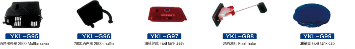
YKL-G95 消音器外罩 2900 Muffler cover YKL-G96 2900消声器 2900 muffler YKL-G97 油箱总成 Fuel tank assy YKL-G98 油箱油标 Fuel meter YKL-G99 油箱盖 Fuel tank cap