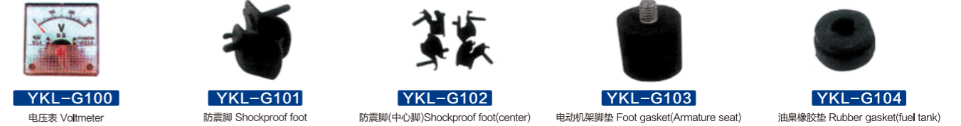
YKL-G100 电压表 Voltmeter YKL-G101 防震脚 Shockproof foot YKL-G102 防震脚(中心脚) Shockproof foot(center) YKL-G103 电动机架脚垫 Foot gasket(Armature seat) YKL-G104 油桌橡胶垫 Rubber gasket(fuel tank)