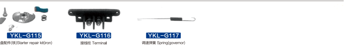
YKL-G115 拉盘配件(铁) Starter repair kit(iron) YKL-G116 接线柱 Terminal YKL-G117 调速弹簧 Spring(governor)