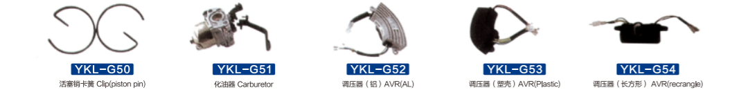
YKL-G50 活塞销卡簧 Clip(piston pin) YKL-G51 化油器 Carburetor YKL-G52 调压器(铝) AVR(AL) YKL-G53 调压器(塑料) AVR(Plastic) YKL-G54 调压器(长方形) AVR(rectangle)