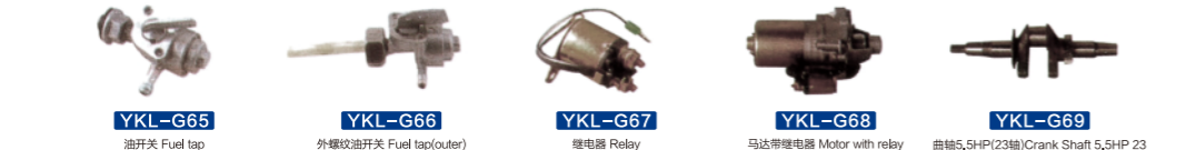
YKL-G65 油开关 Fuel tap YKL-G66 外螺吹油开关 Fuel tap(outer) YKL-G67 继电器 Relay YKL-G68 马达带继电器 Motor with relay YKL-G69 曲轴5.5HP(23轴) Crank Shaft 5.5HP 23