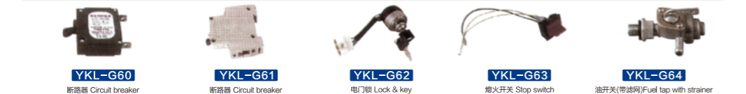
YKL-G60 断路器 Circuit breaker YKL-G61 断路器 Circuit breaker YKL-G62 电门锁 Lock & key YKL-G63 熄火开关 Stop switch YKL-G64 油开关(带滤网) Fuel tap with strainer