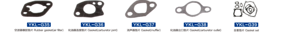
YKL-G35 空滤器橡胶垫片 Rubber gasket(air filter) YKL-G36 化油器连接垫片 Gasket(carburetor joint) YKL-G37 消声器垫片 Gasket(muffler) YKL-G38 化油器出口垫片 Gasket(carburetor outlet) YKL-G39 全套垫片 Gasket set

汽油发动机配件 Gasoline Engine Spare Parts 汽油发电机配件 Gasoline generator accessories 汽油水泵配件 Gasoline water pump spare parts