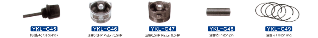
YKL-G45 机油标尺 Oil dipstick YKL-G46 活塞5.5HP Piston 5.5HP YKL-G47 活塞6.5HP Piston 6.5HP YKL-G48 活塞销 Piston pin YKL-G49 活塞环 Piston ring