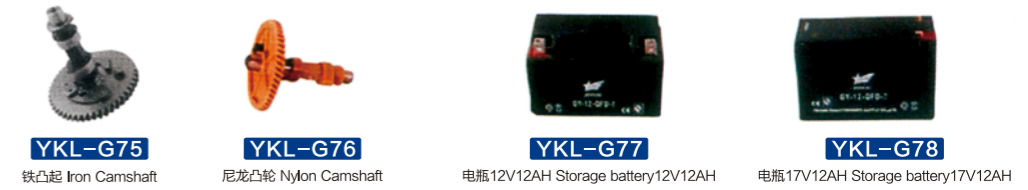
YKL-G75 铁凸起 Iron Camshaft YKL-G76 尼龙凸轮 Nylon Camshaft YKL-G77 电瓶12V12AH Storage battery 12V12AH YKL-G78 电瓶17V12AH Storage battery 17V12AH