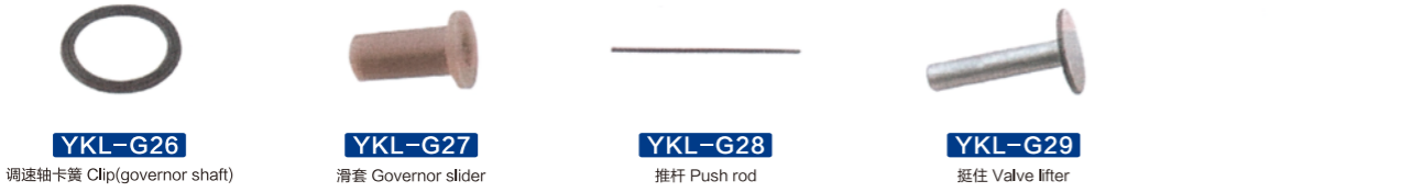
YKL-G26 调速轴卡簧 Clip(governor shaft) YKL-G27 滑套 Governor slider YKL-G28 推杆 Push rod YKL-G29 挺住 Valve lifter