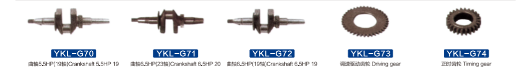
YKL-G70 曲轴5.5HP(19轴) Crankshaft 5.5HP 19 YKL-G71 曲轴6.5HP(23轴) Crankshaft 6.5HP 20 YKL-G72 曲轴6.5HP(19轴) Crankshaft 6.5HP 19 YKL-G73 调速驱动齿轮 Driving gear YKL-G74 正时齿轮 Timing gear