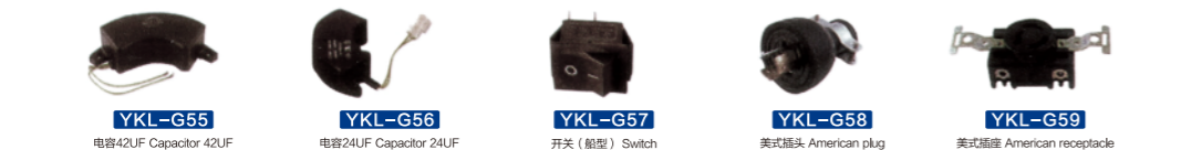
YKL-G55 电容42UF Capacitor 42UF YKL-G56 电容24UF Capacitor 24UF YKL-G57 开关(船型) Switch YKL-G58 美式插头 American plug YKL-G59 美式插座 American receptacle