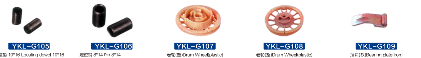
YKL-G105 定位销 10*16 Locating dowel 10*16 YKL-G106 定位销 8*14 Pin 8*14 YKL-G107 卷轮(塑) Drum Wheel(plastic) YKL-G108 卷轮(塑) Drum Wheel(plastic) YKL-G109 挡块(铁) Bearing plate(iron)