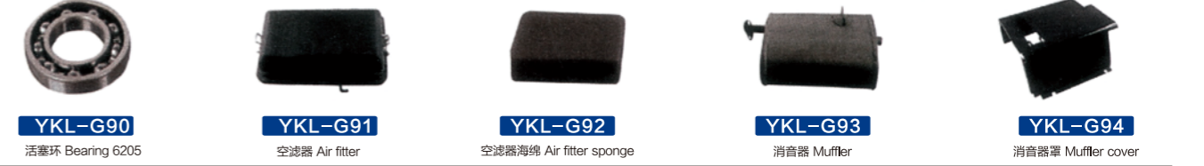
YKL-G90 活塞环 Bearing 6205 YKL-G91 空滤器 Air filter YKL-G92 空滤器海绵 Air filter sponge YKL-G93 消音器 Muffler YKL-G94 消音器罩 Muffler cover