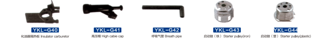
YKL-G40 化油器隔热板 Insulator carburetor YKL-G41 高压帽 High cable cap YKL-G42 呼吸气管 Breath pipe YKL-G43 启动鼓(铁) Starter pulley(iron) YKL-G44 启动鼓(塑) Starter pulley(plastic)