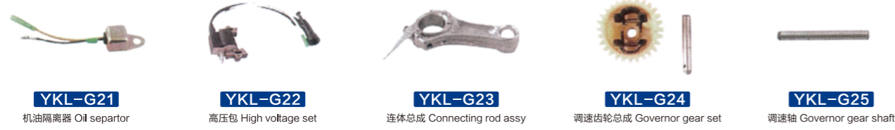
YKL-G21 机油分离器 Oil separator YKL-G22 高压包 High voltage set YKL-G23 连体总成 Connecting rod assy YKL-G24 调速齿轮总成 Governor gear set YKL-G25 调速轴 Governor gear shaft