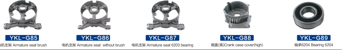
YKL-G85 电机支架 Armature seat brush YKL-G86 电机支架 Armature seat without brush YKL-G87 电机支架 Armature seat 6203 bearing YKL-G88 箱盖(高) Crank case cover(high) YKL-G89 轴承6204 Bearing 6204