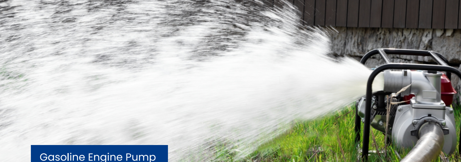
Gasoline Engine Pump 汽油机水泵