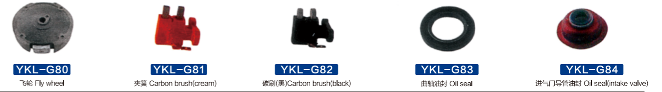
YKL-G80 飞轮 Fly wheel YKL-G81 夹簧 Carbon brush(cream) YKL-G82 碳刷(黑) Carbon brush(black) YKL-G83 曲轴油封 Oil seal YKL-G84 进气门导管油封 Oil seal(intake valve)